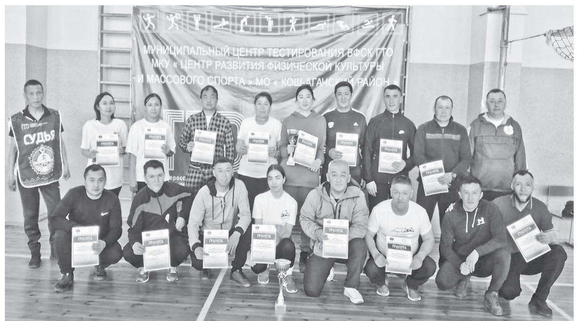
Участники спортивного мероприятия