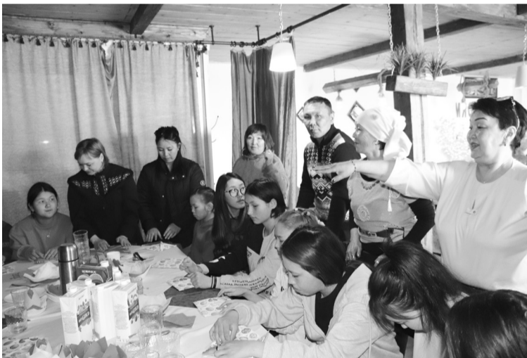
Момент мастер - класса

Также поговорили об особенностях национального стола, обсудили традиции празднования Наурыз. Следуя неперемной традиции дан-