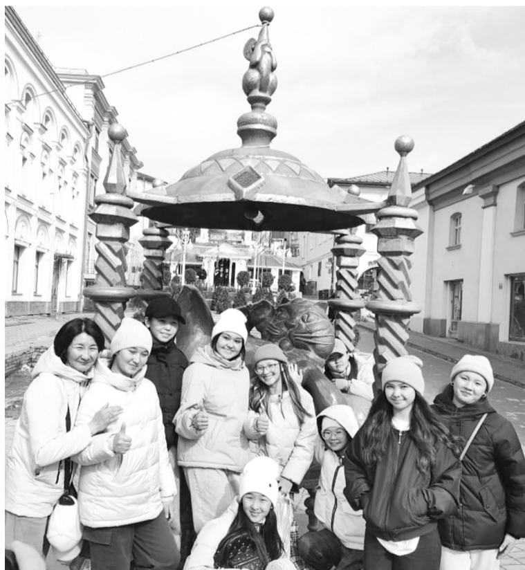
Прогулка по городу