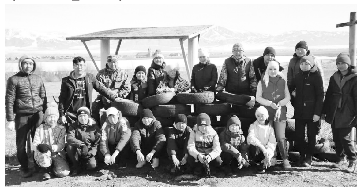
Субботник- важное событие в жизни коллектива