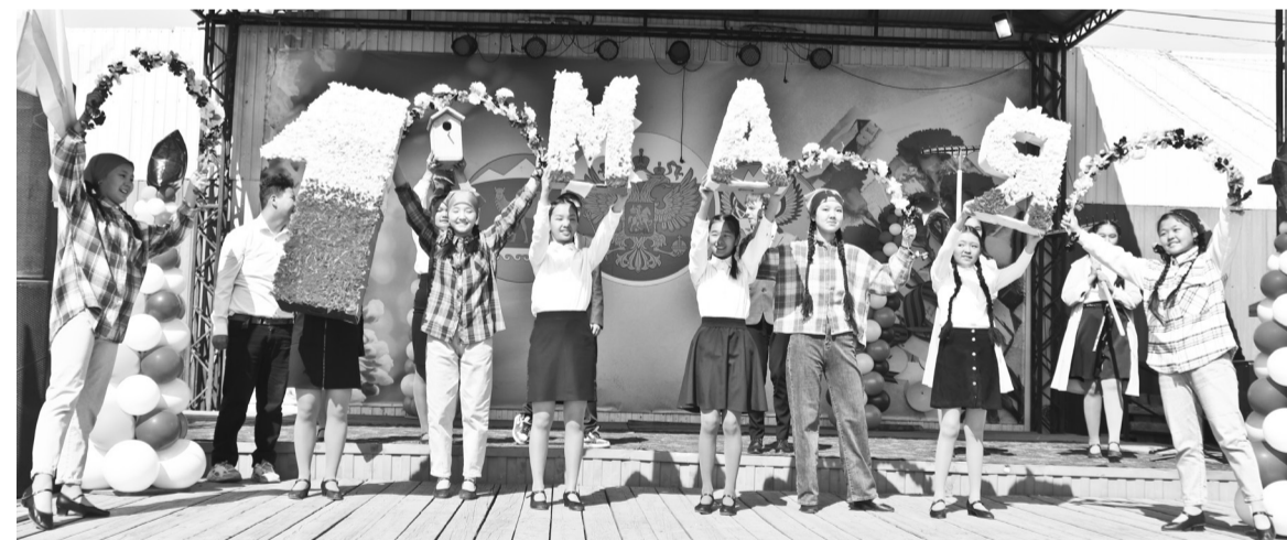
Танец Весны и труда

ди состоялся праздничный концерт. Зрители аплодисментами встречали выступления мастеров искусств Кош-Агачского района. Далее праздник продолжился на ипподроме «Аламан» села Кош-Агач традиционными конными скачками.