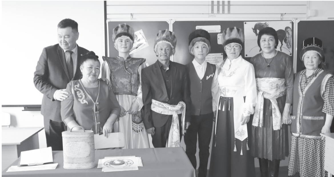
Айылчылар ачылган кыпта

алтай школда үренип, алтай тилди баалап, оморкоп турганын жетирди. Башчы аймактын школдоры билгирин тыгыдып, жакшы жедимдерге жетсе, мынан да ары муниципал төзөм жөмөлтө эдерин угусты.