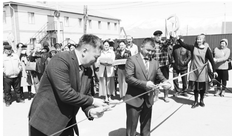
Открытие Доски почета

По завершении торжественной части праздника на площа-