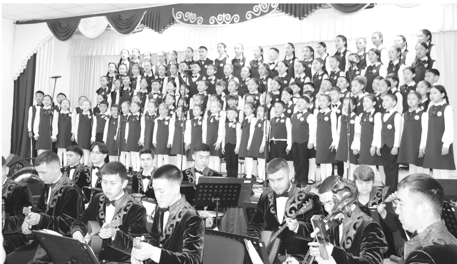
Гимн РФ в исполнении хора

Поздравляем всех участников и руководителей с блестящей премьерой. Желаем нашему коллективу новых творческих побед.