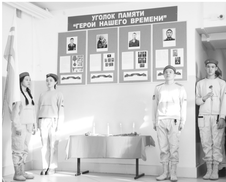
Мемориальная Доска в школе имени В.И. Чаптынова