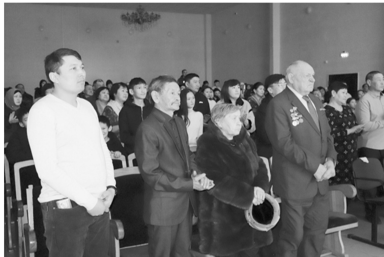
Зрители стоя чтят память героев