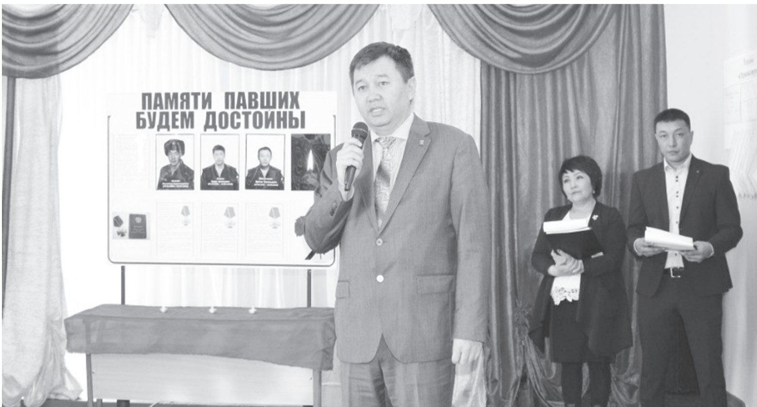
Открытие Уголка памяти в селе Ортолык

Сегодня исполняется ровно год с начала специальной военной операции на Украине. И хотя подводить военные итоги преждевременно, об одном умолчать нельзя - о неравнодушии и отзывчивости наших людей.