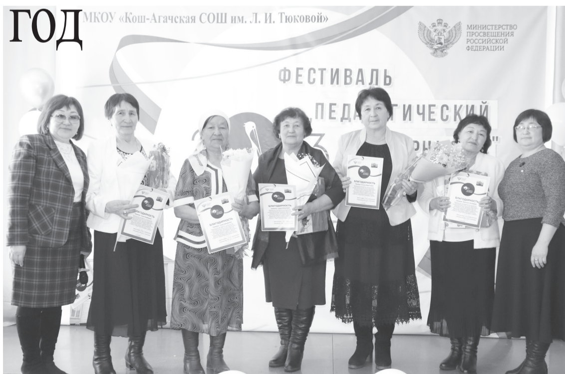
Ветераны педагогического труда