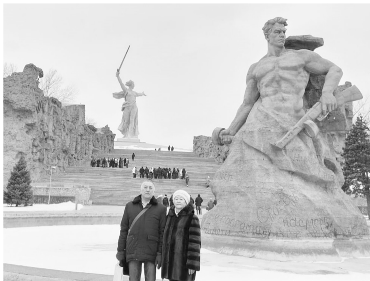
Возле памятника участникам Сталинградской битвы

В последующие дни между торжественными мероприятиями посетили