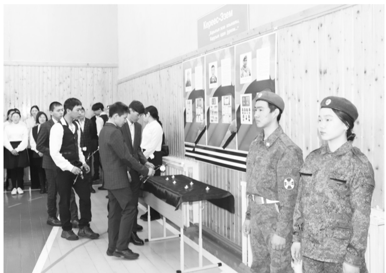
Возложение цветов в Кокоринской школе