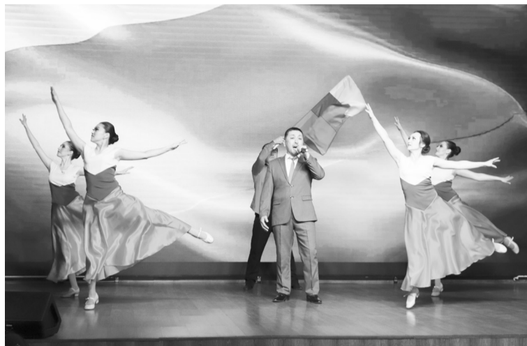
Концерт в поддержку участников СВО

«Нельзя ни на минуту останавливать работу по поддержке СВО, ни на секунду. Нельзя, чтобы это превращалось в рутину, в привыч-