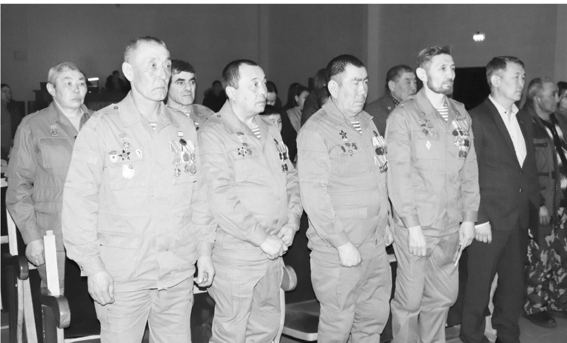
Афганцы Кош-Агачского района