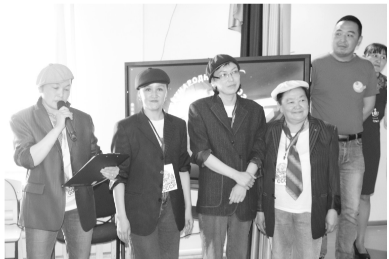
«Рожденные в СССР»

По признанию жюри, которое оценивало выступления конкурсантов, каждой команде удалось раскрыть свои таланты, найти оригинальный подход к каверзным заданиям, а многие шутки, например, об опаздывающих педагогах и участии в профессиональных конкурсах надолго запомнятся всем зрителям.