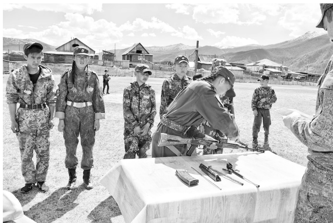
«Зарница» в Джазаторе