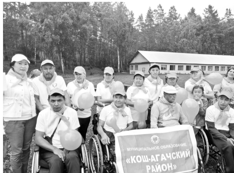
Участники парафестиваля