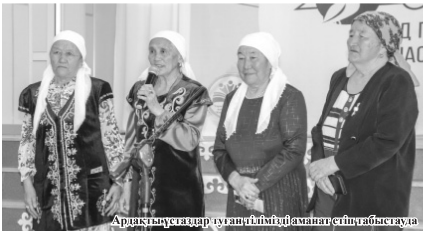
Ардақты ұстаздар туған тілімізді аманат етіп табыстауда

Тіл туралы жазу, ол туралы айтудан қашпау да, жалықпау да керек. Себебі тіл бүкіл бір халықтың жүрегі. Оның бойында ұлттық болмыс, ұлттық рух, дәстүр мен салт жатыр. Сондықтан әр халық өз тілінде мақтанып қана қоймай, оны дамытып, жұмыс жасауымыз керек.