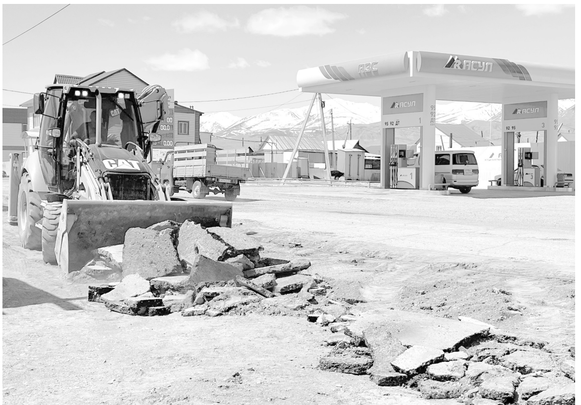
Снятие старого покрытия