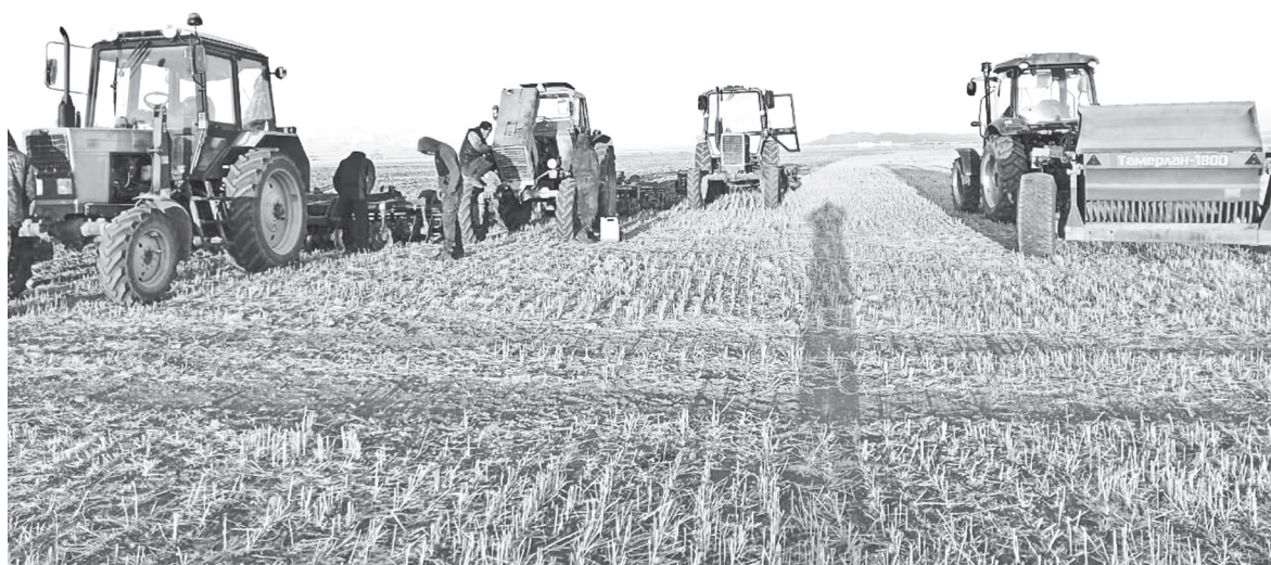
Посевная в разгаре