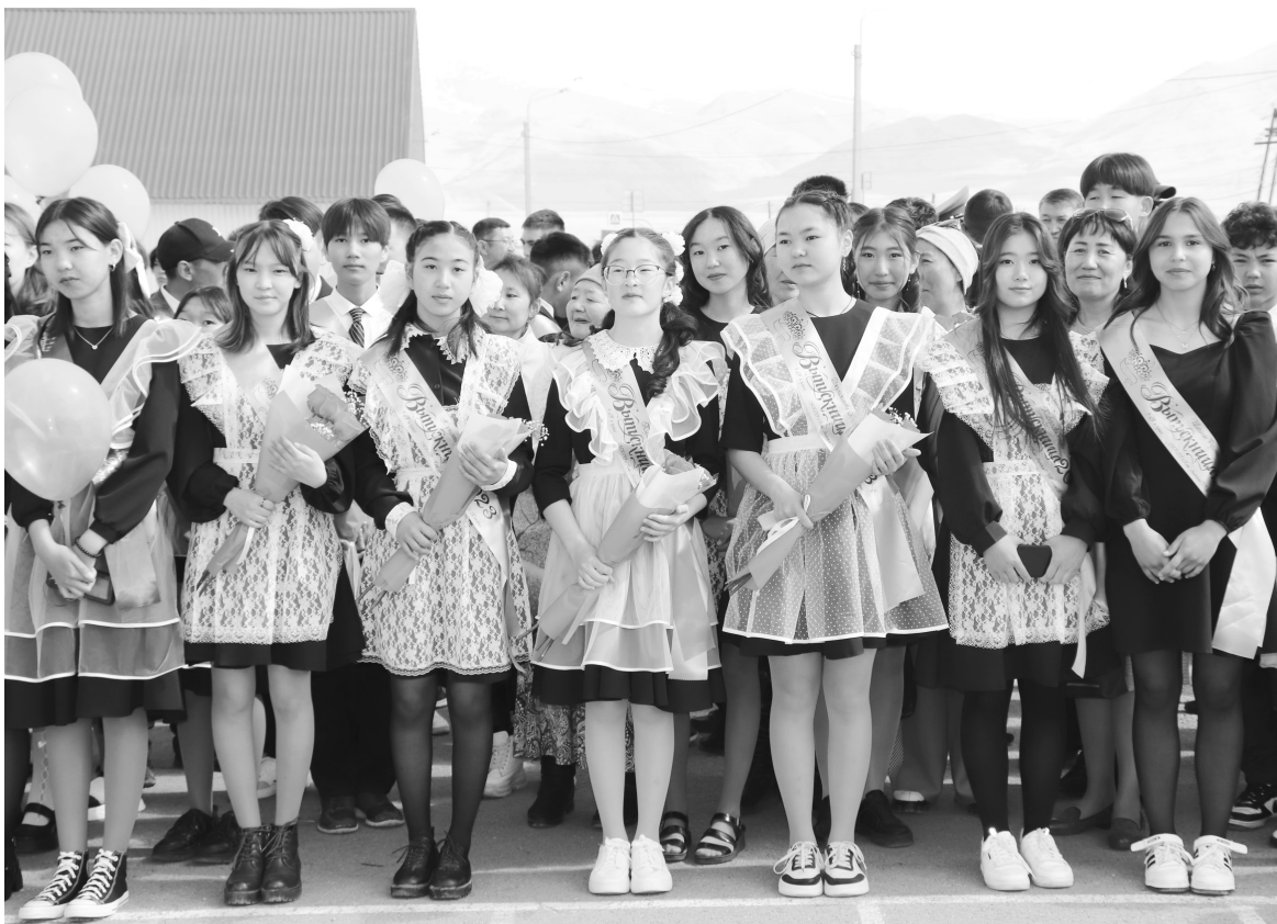
Выпускники 9 класса