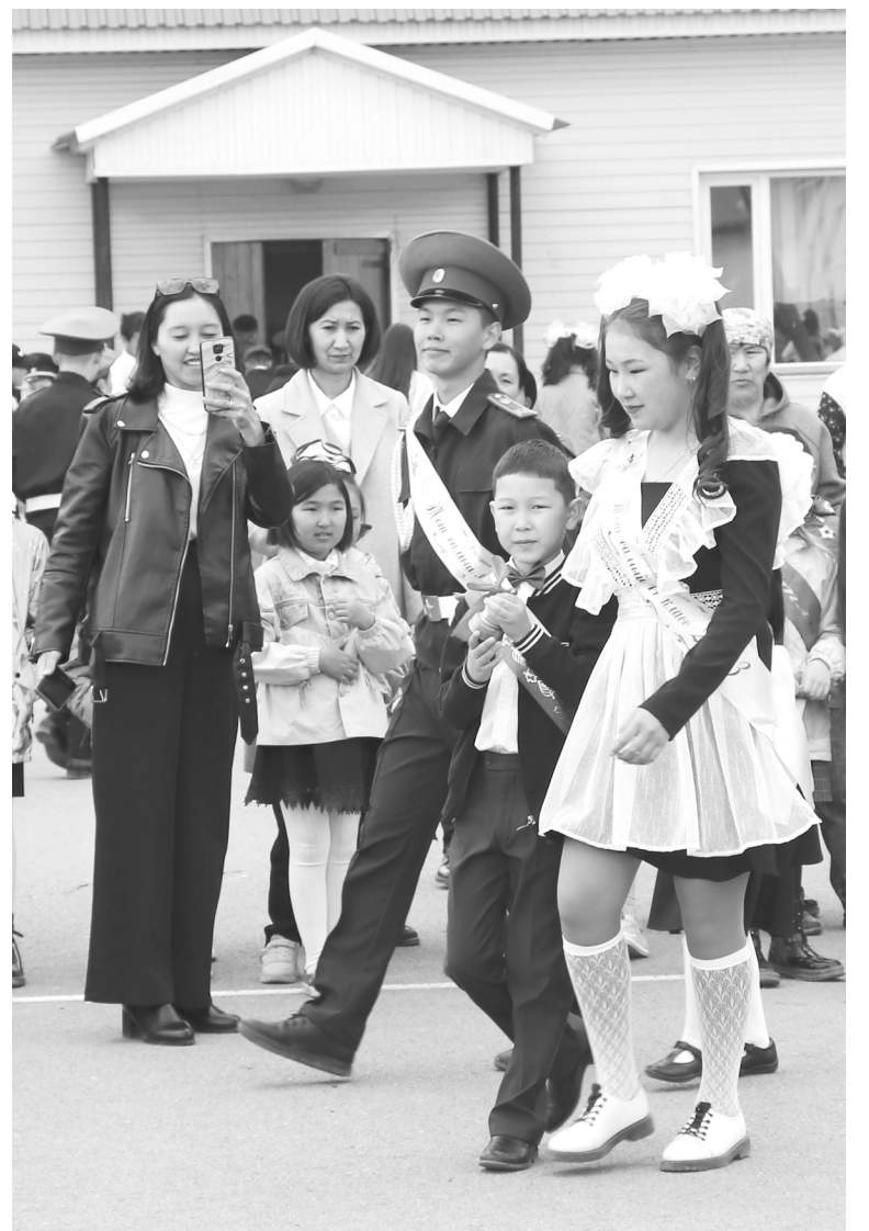
Звонит последний звонок