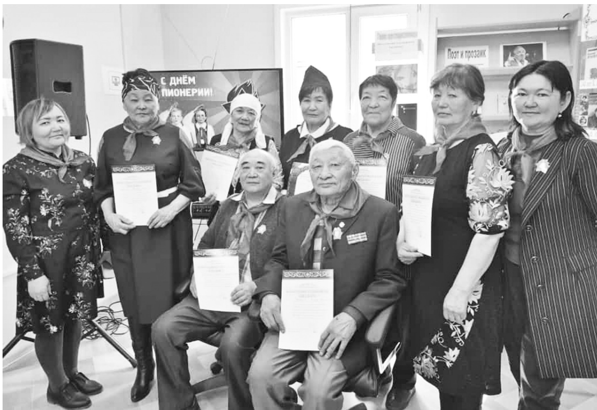
Ветераны пионерского движения и организаторы праздника