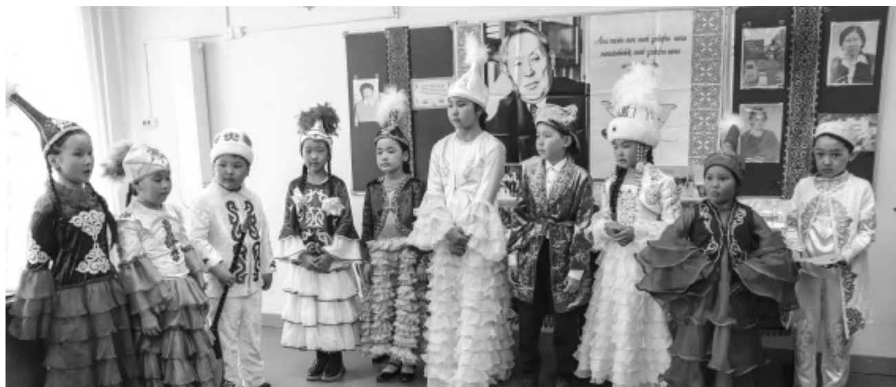
В.И. Чаптынов атындағы орта мектептің өнерлі оқушылары

Тіл өлсе, ұлттың да өмір сүруі мүмкін емес. Сондықтан сіз қай ұлттың өкілі болмаңыз, тіл үшін күресуге міндеттісіз. Сол тілде сөйлейтін соңғы адам болсаңыз да, тіліңіз жайында аманат қалдыруға, мұра қалдыруға тырысуыңыз керек. Себебі сіздің тілде жазылған құнды тарихи деректер, кейінгі ұрпақ үшін үлкен рөл ойнауы мүмкін. Мәселен кезіндегі орхон жазулары, руна жазулары бүгінгі көптеген түркі халықтарына тән тарихи деректердің көзін ашып беріп отыр.