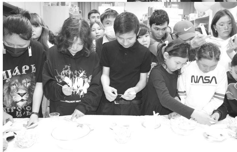
Ребятам понравились увлекательные конкурсы

Продолжилась акция мастер-классами «Стильный читатель»,