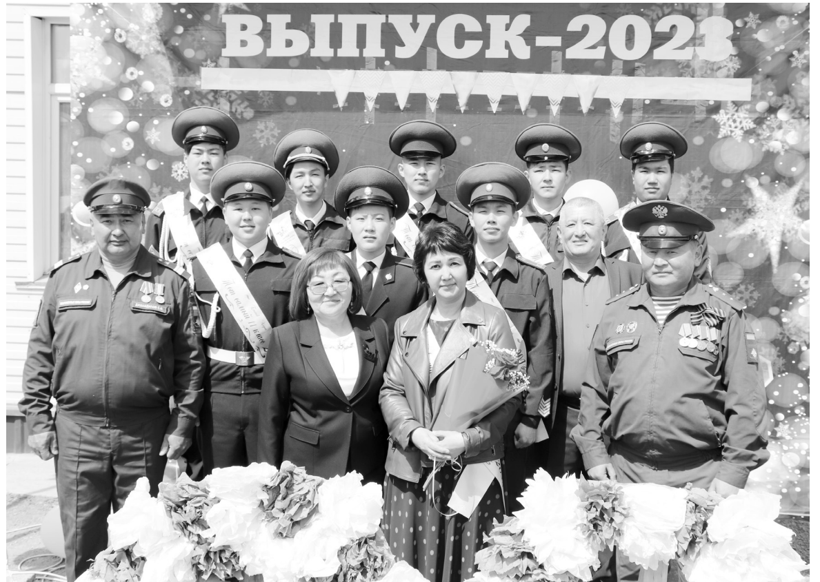
Кадеты с наставниками