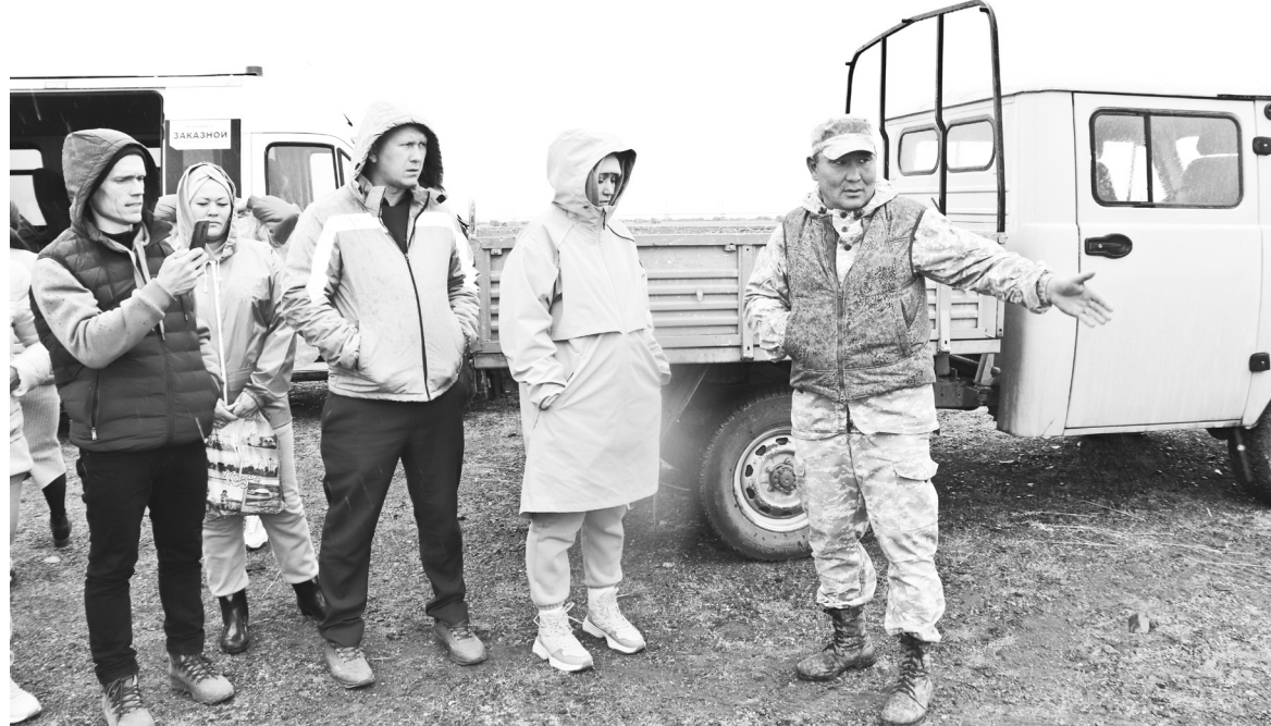
Демонстрация поля делегации из Республики Татарстан, осень 2022 года

В прошлом году наши хозяйства заготовили 2880 центнеров многолетних трав и 71 190 центнеров естественного сена, что в целом составило порядка 95 000 центнеров. «В этом году зима нас порадовала устойчивым снежным покровом, влажность почвы хорошая, однако низкие весенние показатели температуры, влияющие на