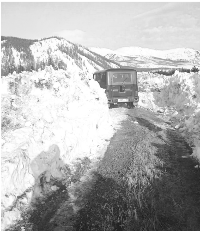
Дорога в Аргут расчищена