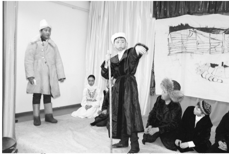
На сцене молодые актеры Жана-Аульской средней школы

И вот театральное таинство началось. Первыми на сцену вышли юные артисты из Ортолыкской средней школы с постановкой «Гроза» Н. Островского и «Как совесть хозяина искала» Л. Устинова. Один за другим выходили на сцену детские творческие коллективы района. Каждый из них по-своему выстраивал режиссуру своего спектакля, каждый участник фестиваля нес именно свою, первоначально задуманную им идею. Причём в каждом спектакле эта линия очень чётко прослеживалась. Где-то присутствовали воспитательные моменты, где-то назидательные, где-то сверкал откровенный почти безграничный юмор, а в некоторых случаях - слышна была пронзительная боль за содеянное и уже непоправимое... Следует признать, что каждый детский коллектив играл неповторимо, абсолютно по-иному, нежели все остальные его участники. И поэтому смотреть и следить за ходом разворачивающихся на сцене событий - было интересно и увлекательно. Лица зрителей то светлели от вдохновенного детского перевоплощения, то слегка темнели от ситуаций, в которых разворачивались тревожные события. И иногда грустнели, потому что родители или педагоги переживали за своих воспитанников, у которых далеко не всё получалось, хотя те старались очень-очень! Тем не менее, как бы то ни было, в целом впечатление от всех просмотренных спектаклей было хорошее и радостное. Ведь это же дети! И они пока ещё учатся. Учатся двигаться на сцене, чётко проговаривать слова, то есть пытаются про-