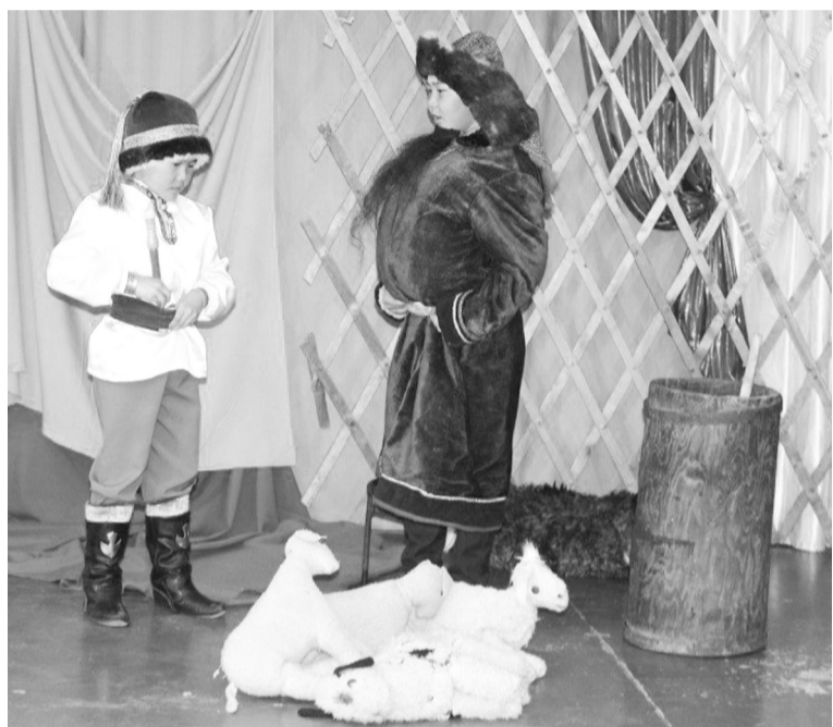
Юные актеры Бельтирской средней школы