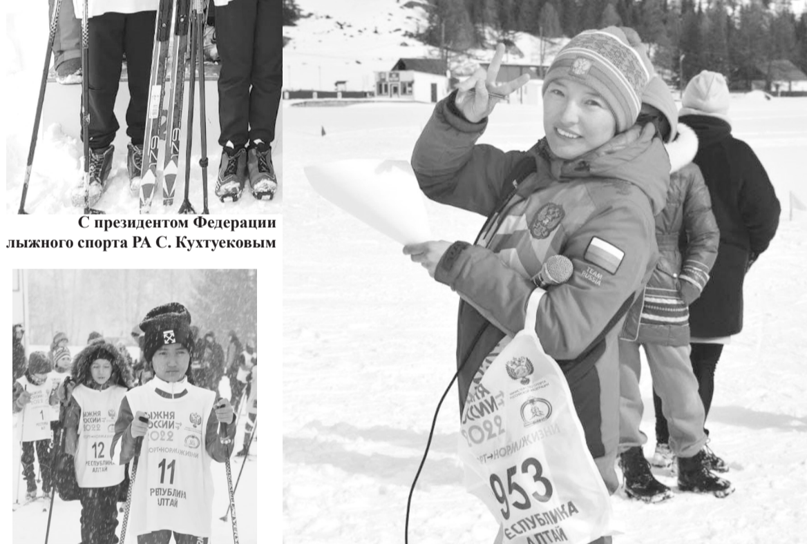
С президентом Федерации лыжного спорта РА С. Кухтековым