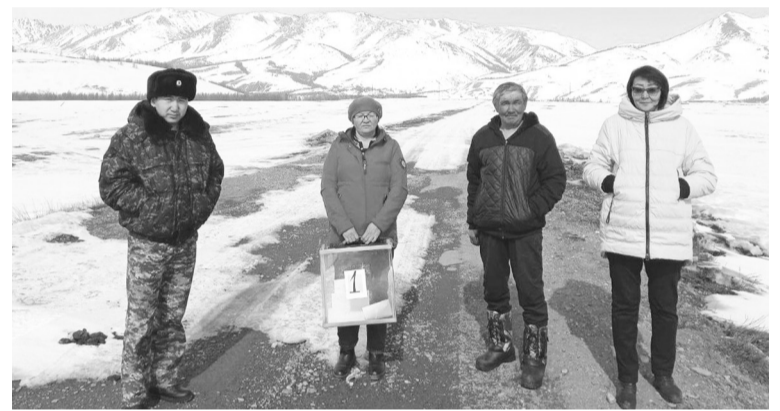
Выезд на голосование в труднодоступных местах

Данные о числе голосов избирателей, полученных каждым из зарегистрированных кандидатов на выборах главы муниципального образования «Курайское сельское поселение»