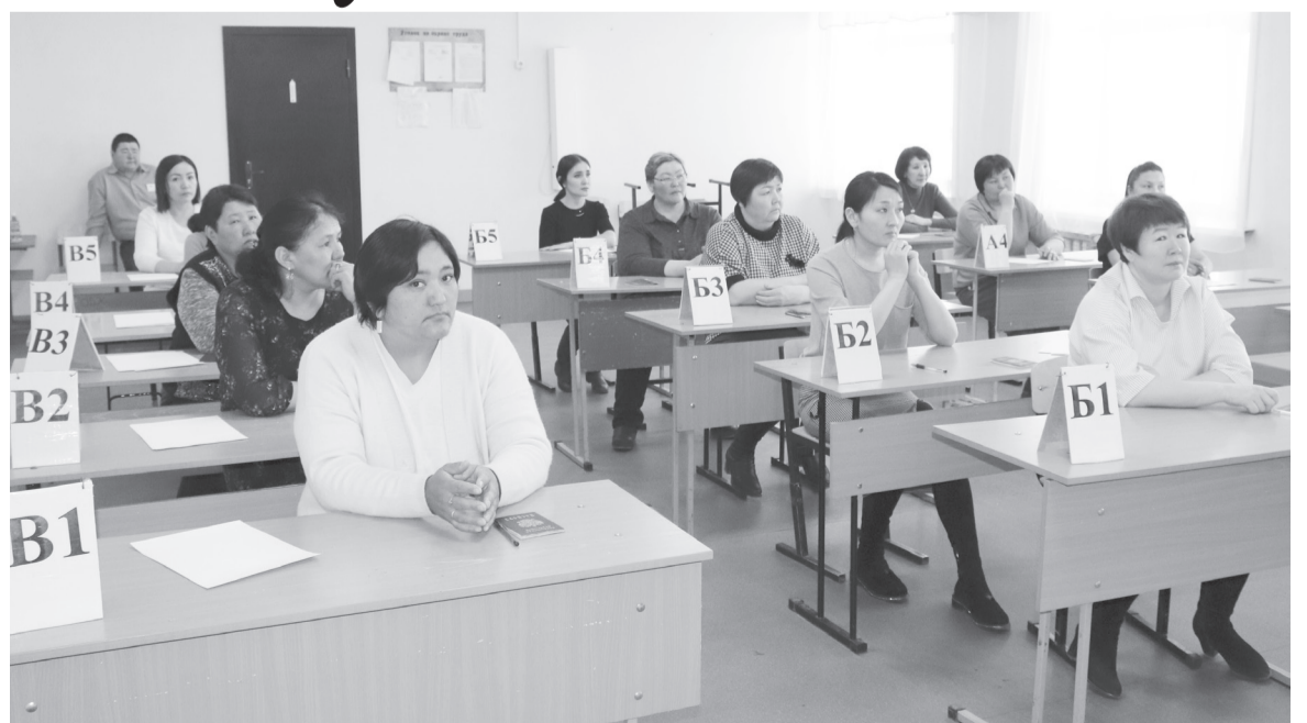
Родители выпускников перед экзаменом