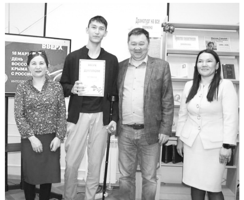
Диплом вручается команде молодежи