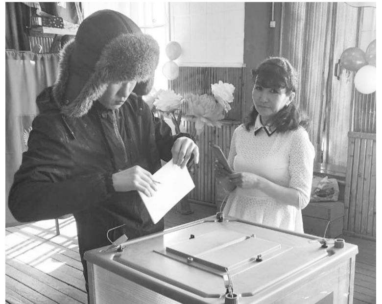
Голосует самый молодой избиратель