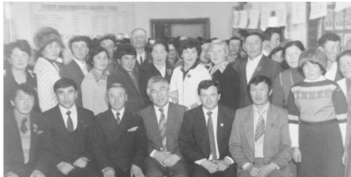
Участники пленарного заседания