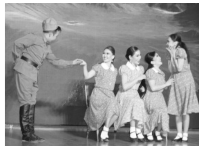
Танцоры ансамбля «Алтам»