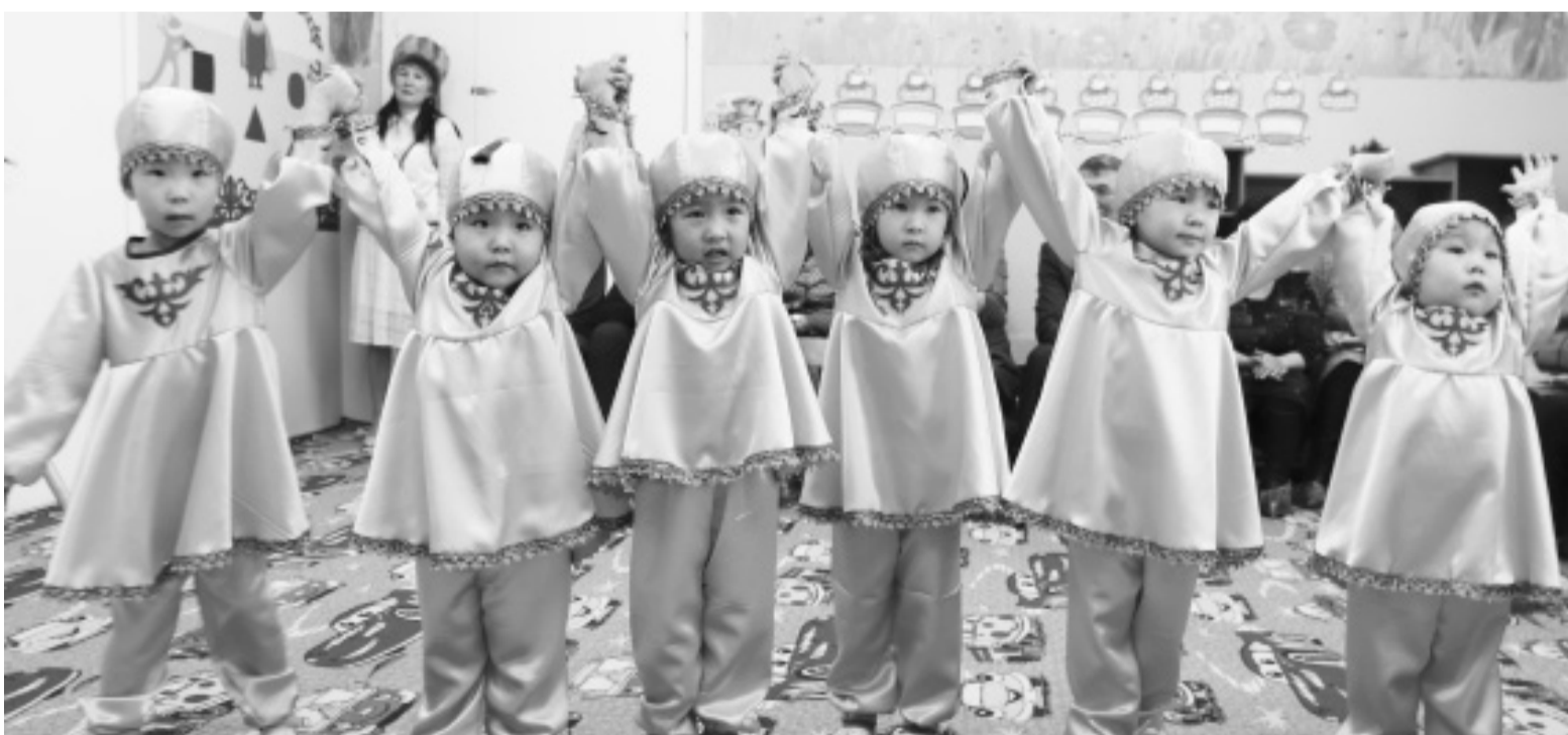
Воспитанницы детского сада «Айучак»

Начало на 1 странице В рамках регионального проекта детские сады создают условия для обучения алтайскому языку через создание развивающей предметно-пространственной среды в ДОО: это создание мини-музеев, уголков для сюжетных игр детей, и, конечно, активная работа с родителями при подготовке совместных мероприятий на родном языке.