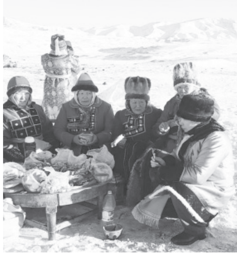
Чагаа-Байрамнын мүргүүли, Эне-Белтир, 2023 жыл Чаган айдын 29-чы күни