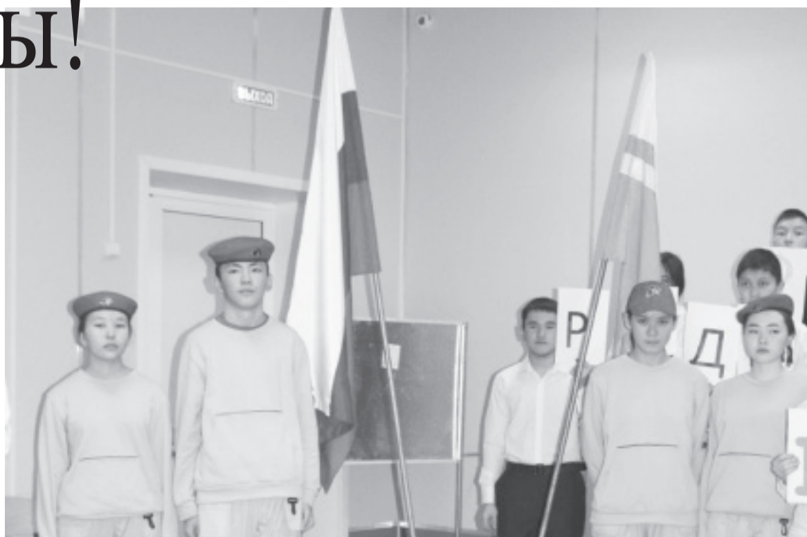
На торжественной линейке