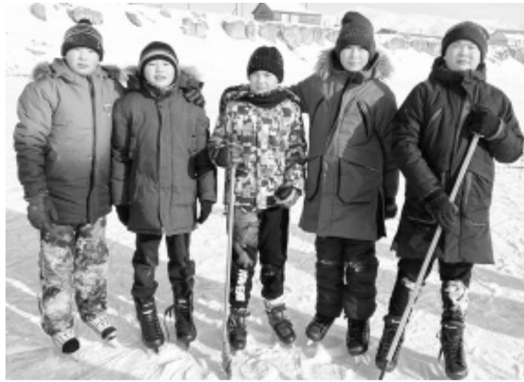
Участники «Дня здоровья»