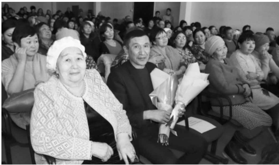
Самые верные и преданные поклонники

Я благодарна судьбе, что мне довелось посвятить свою жизнь культуре и попробовать себя не только в роли вокалиста, но и танцора и акте-